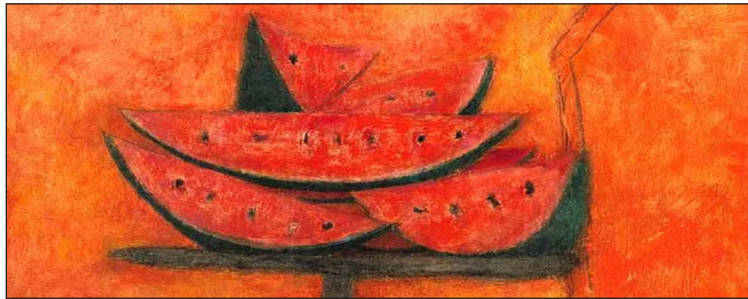
Rufino Tamayo, Snacías

El arte es un medio de expresión que debe ser comprendido por todos en todas partes. Surge de la tierra, las texturas de nuestras vidas y nuestras experiencias. -Rufino Tamayo